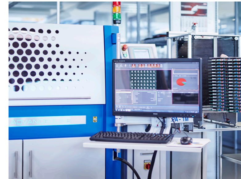
Qualität setzt Maßstäbe - fertig bestückte Leiterplatten bei der Endprüfung

In unserem EMV Labor bieten wir Ihnen die Messung elektromagnetischer Verträglichkeit, unter anderem an industriellen, wissenschaftlichen und medizinischen Geräten nach DIN EN-Prüfnormen an. Darüber hinaus übernehmen wir für Sie Vorabmessungen in unserer GTEM-Zelle zur Vorbereitung zertifizierter Prüfungen und beraten Sie bei EMV-Maßnahmen.