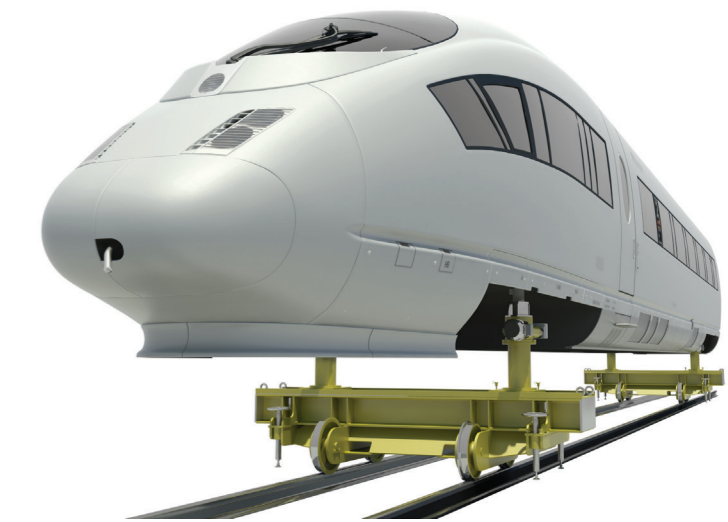
Fertigung und Instandhaltung an Wagenkästen schienengebundener Fahrzeuge.