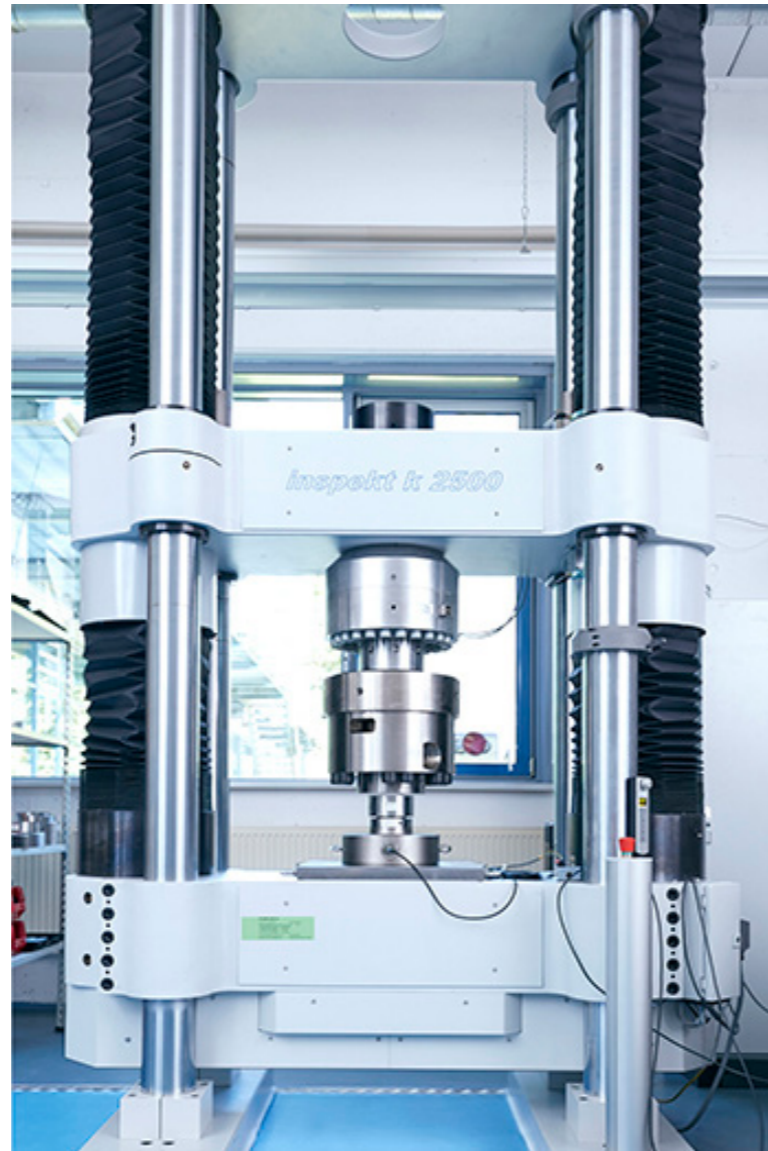
Wir führen DAkkS-Kalibrierungen von 500N bis in den Hochlastbereich von bis zu 2MN durch.