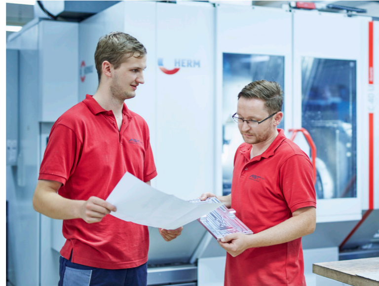
Moderne Maschinen sowie sehr gut qualifizierte Mitarbeiter garantieren höchste Qualität

Zum Abschluss jeder Fertigung erfolgt die professionelle Qualitätssicherung. Dabei gewährleisten unsere modernen Messmaschinen zur Endkontrolle höchste Qualität. Der Versand der Ware erfolgt an Sie als unseren Kunden oder im Bedarfsfall an Ihren Endkunden.