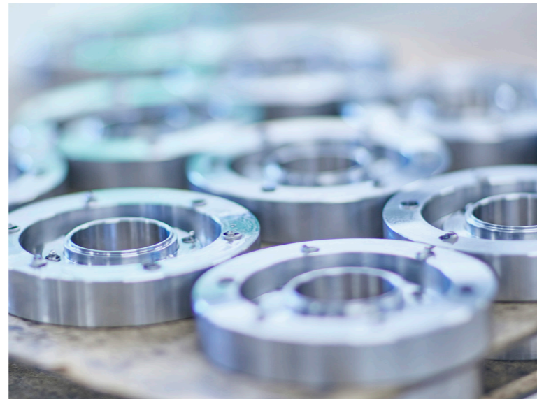
Genauigkeit ist alles! Nichts dem Zufall überlassen – strenge Qualitätskontrollen sind die Voraussetzung für unsere hohen Qualitätsansprüche